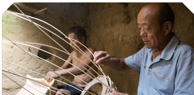
锦绣非遗走访 - 河北广宗县柳编