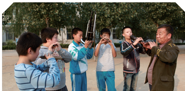
锦绣非遗走访 - 河北广宗县太平道乐