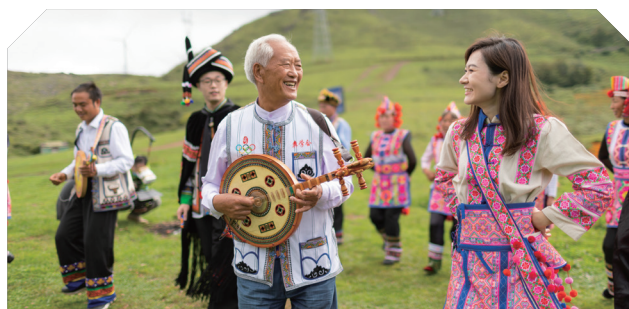
锦绣非遗走访 - 云南丘北县璇子舞