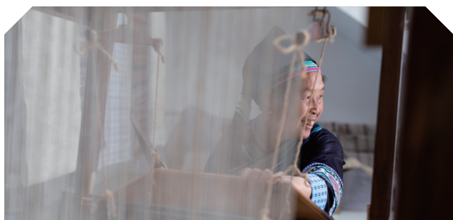
锦绣非遗走访 - 云南丘北县火草被