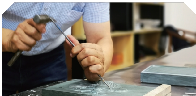
锦绣非遗走访 - 甘肃临洮县洮砚