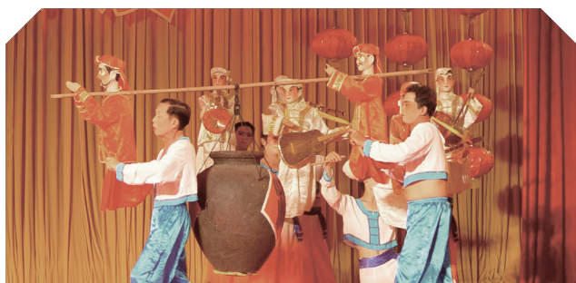
锦绣非遗走访 - 海南临高县人偶戏