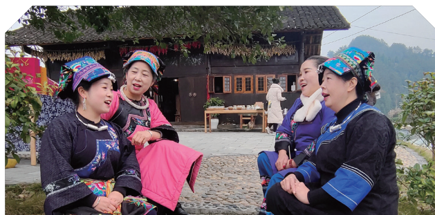
锦绣非遗走访 - 湖南花垣县苗族古歌