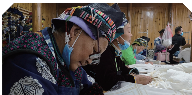
锦绣非遗走访 - 贵州丹寨：非遗小镇回访